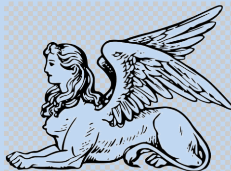
Figura 4. Imagen tomada de: https://www.pngocean.com/gratis-png-clipart-dz

[ https://www.youtube.com/watch?v=wkWZAX8iBME ]