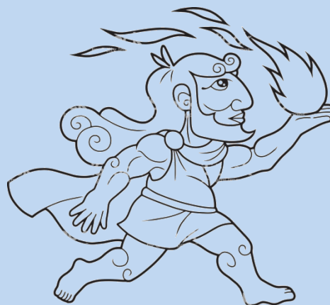
Figura 4. Imagen tomada de: https://es.dreamstime.com/vector-griego-del-colorante-de-la-criatura-mito-medusa-image115368918

[ https://www.youtube.com/watch?v=BSnD09f0IXs ]